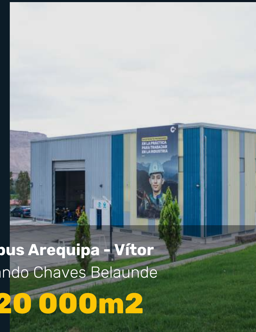
Campus Arequipa - Vitor Fernando Chaves Belaunde +120 000m 2