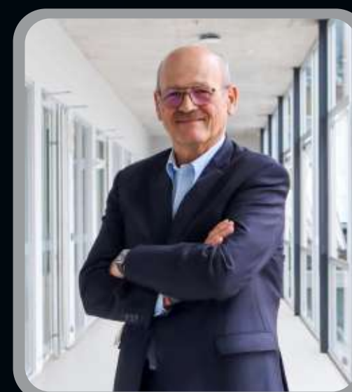
Iniciativas para el crecimiento del sector