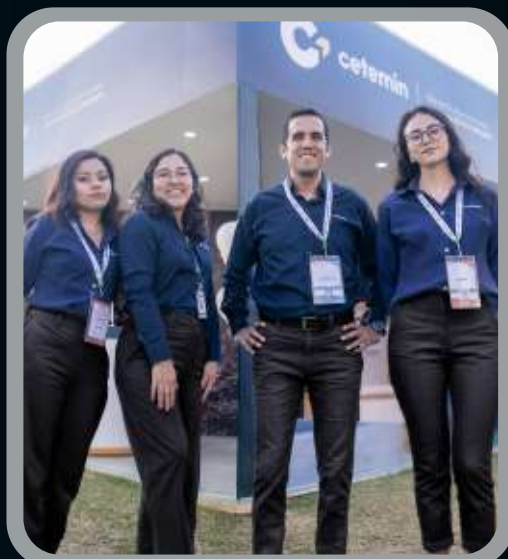
Participación en eventos en el sector