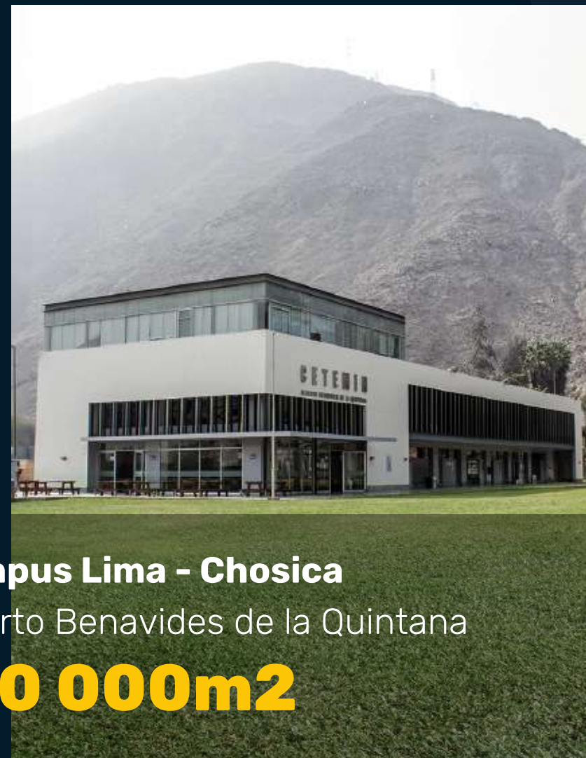
Campus Lima - Chosica Alberto Benavides de la Quintana +10 000m 2

Sedes equipadas para brindar formación y capacitación de calidad, con un enfoque práctico y alineado a las necesidades del sector minero e industrial.