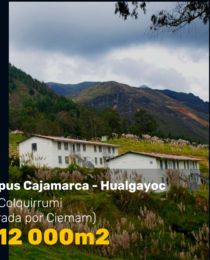
Campus Cajamarca - Hualgayoc U.M. Colquirrumi (Operada por Ciemam) +112 000m 2