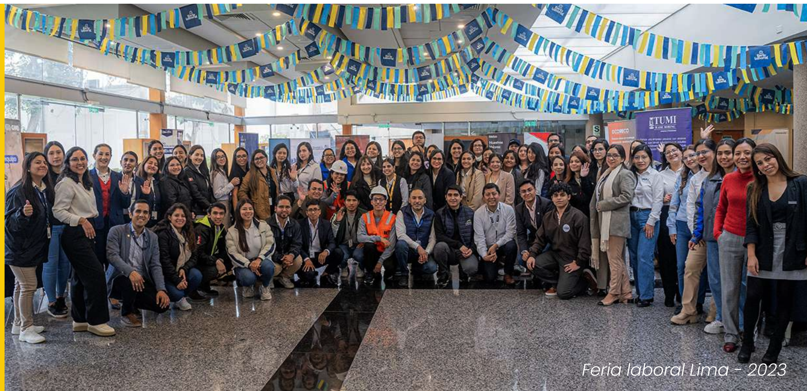
Feria laboral Lima - 2023

Estamos comprometidos con el impulso del sector a través de la participación activa en diversas iniciativas que buscan fortalecer y desarrollar el sector minero e industrial.